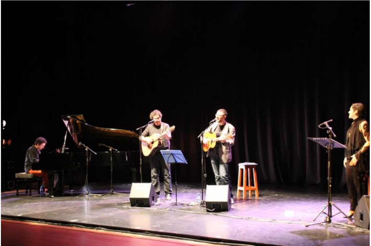
Versos de otro tiempo. Mujeres poetas de la Generación del 27